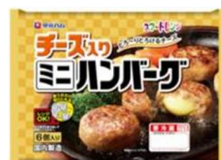
チーズ入りミニハンバーグ