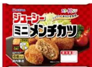
ジューシーミニメンチカツ