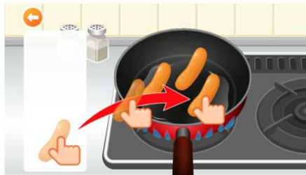
フライパンに乗せて焼こうね！