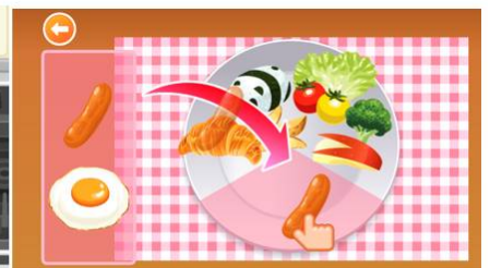
盛り付けをしよう！