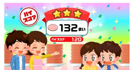
たくさん頑張ったね〜！