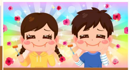
朝ごはんをしっかり食べて1日元気に過ごそうね！