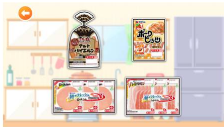
今日はどれを食べようかな？

ゲームの中ではソーセージを焼いたり、ハムなどを盛り付けして、朝ごはんを作ります。食育の観点から、朝ごはんが大切であること、赤・黄・緑をモチーフにした食材をバランスよく食べることで健康が保たれることをお皿に盛りつけることで学ぶことができます。