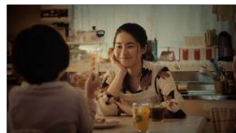
お母さんの笑顔の理由