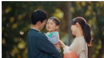
思うようにいかないことも多いけど