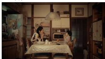
子供だった私への