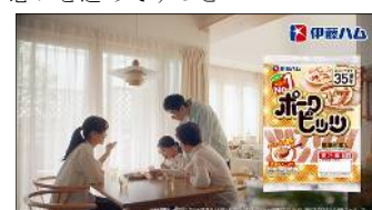
35周年のポークピッツ