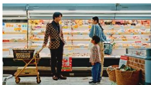
なにでえらんでいますか？