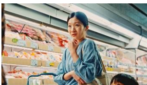
値段とか、食感とか。。。