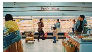
ちがう、ちがう！ ♪そうじゃ、そうじゃない♪