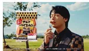
♪アルトバイエルン～