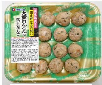
大葉れんこん入り