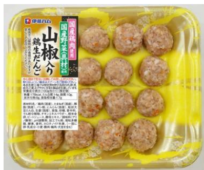
鶏生だんご山椒入り